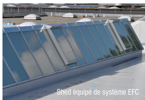
Shed 4quip4 de syst4me EFC