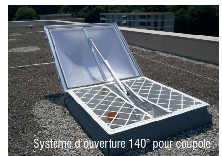
Syst4me d'ouverture 140° pour coupole