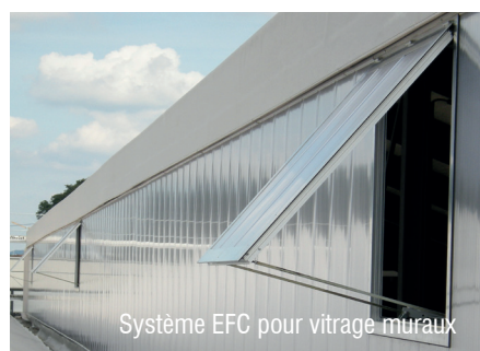
Syst4me EFC pour vitrage muraux