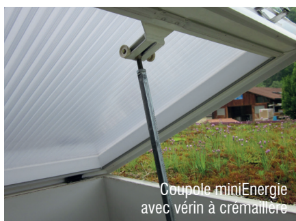
Coupole miniEnergie avec vérin à crémaillère