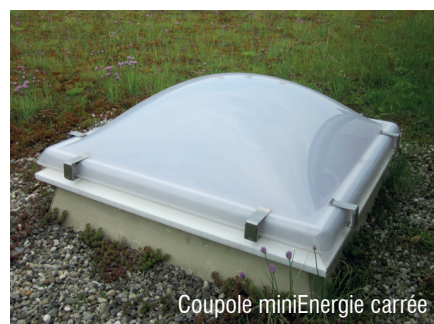
Coupole miniEnergie carrée