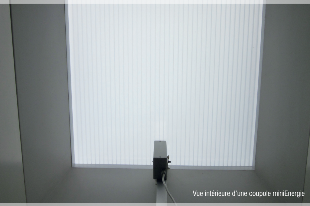
Vue intérieure d'une coupole miniEnergie