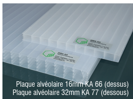
Plaque alvéolaire 16mm KA 66 (dessus) Plaque alvéolaire 32mm KA 77 (dessous)