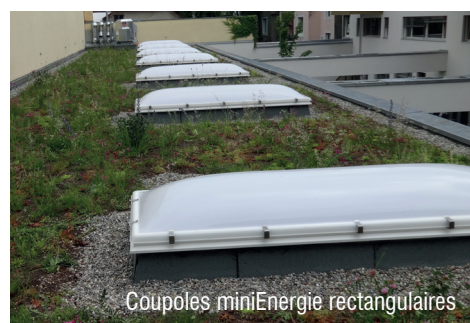
Coupoles miniEnergie rectangulaires